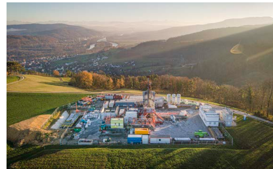
Blick von der Nagra-Bohrung «Bözberg-1» bis zum Alpenkamm.

die ausgehend vom aktuellen Kenntnisstand, den Anforderungen an die Langzeitsicherheit am nächsten zu kommen verspricht.