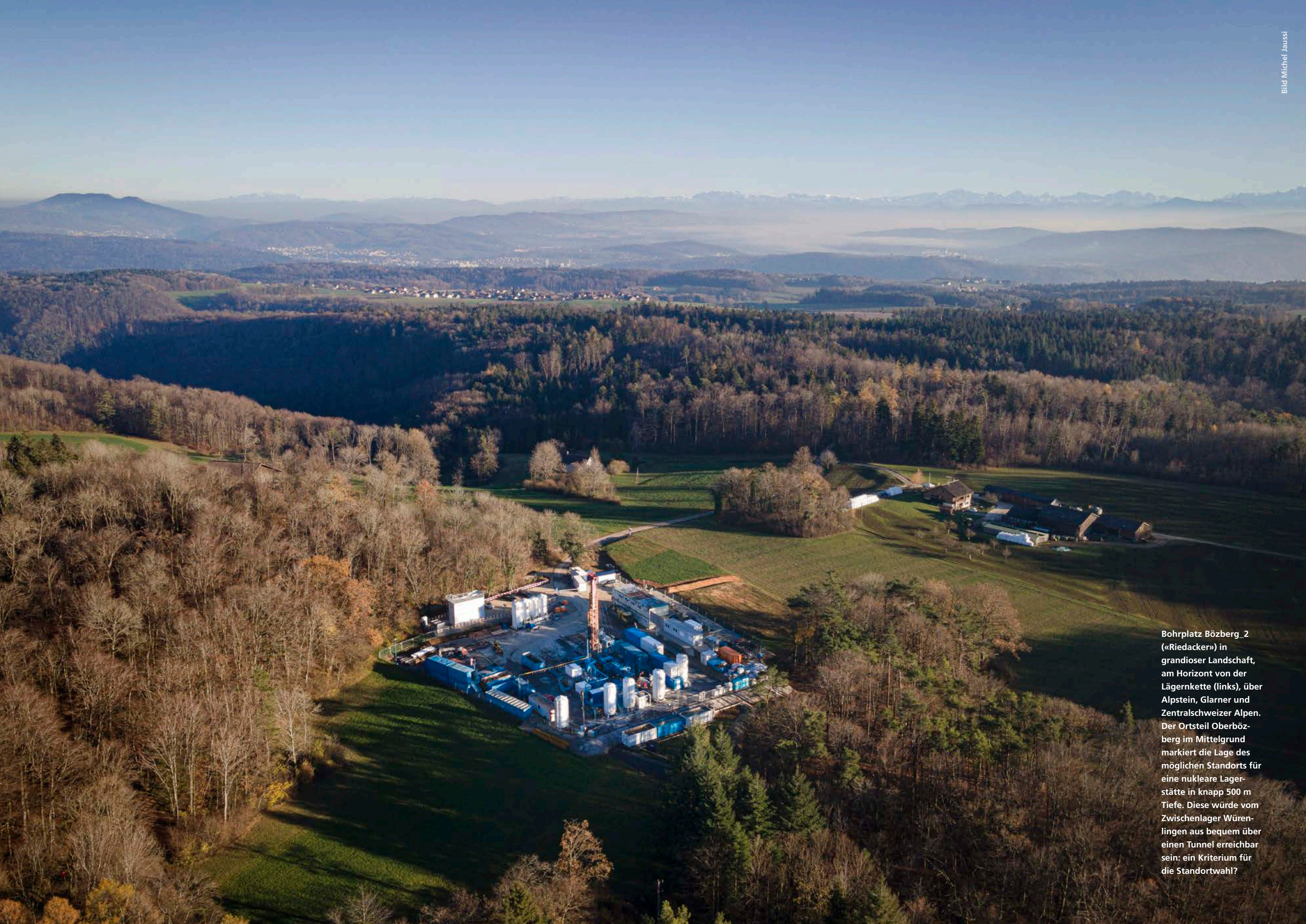
Bohrplatz Bözberg_2 («Riedacker») in grandioser Landschaft, am Horizont von der Lägernkette (links), über Alpstein, Glarner und Zentralschweizer Alpen. Der Ortsteil Oberbözberg im Mittelgrund markiert die Lage des möglichen Standorts für eine nukleare Lagerstätte in knapp 500 m Tiefe. Diese würde vom Zwischenlager Würenlingen aus bequem über einen Tunnel erreichbar sein: ein Kriterium für die Standortwahl?